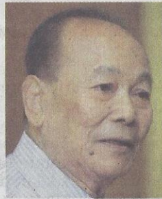
TUNKU ABDUL AZIZ

pada 4 Disember lalu sekali gus memberi isyarat bahawa tidak akan ada lagi perbincangan