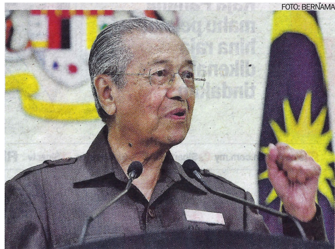
Dr Mahathir pada sidang media menjejaskan projek ECRL di Bangunan Perdana Putra, semalam.

Perdana Menteri, Tun Dr Mahathir Mohamad berkata demikian ketika diminta mengulas sama ada perjanjian baharu antara Malaysia Rail Link Sdn Bhd (MRL) dengan China Communications Construction Company Ltd (CCCC) yang dimeterai baru-baru ini turut mem-