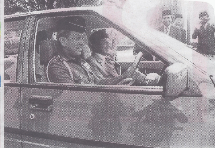
Sultan Ibrahim memandu Proton Saga generasi pertama untuk menghantar Dr Mahathir ke Lapangan Terbang Antarabangsa Senai, semalam, manakala gambar kanan pula dirakam pada 10 Julai 1985 menunjukkan Sultan Iskandar Sultan Ismail ketika itu Yang di-Pertuan Agong, memandu kereta yang sama pemberian Kerajaan Pusat, bersama Dr Mahathir.