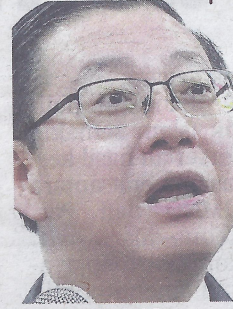
LIM GUAN ENG