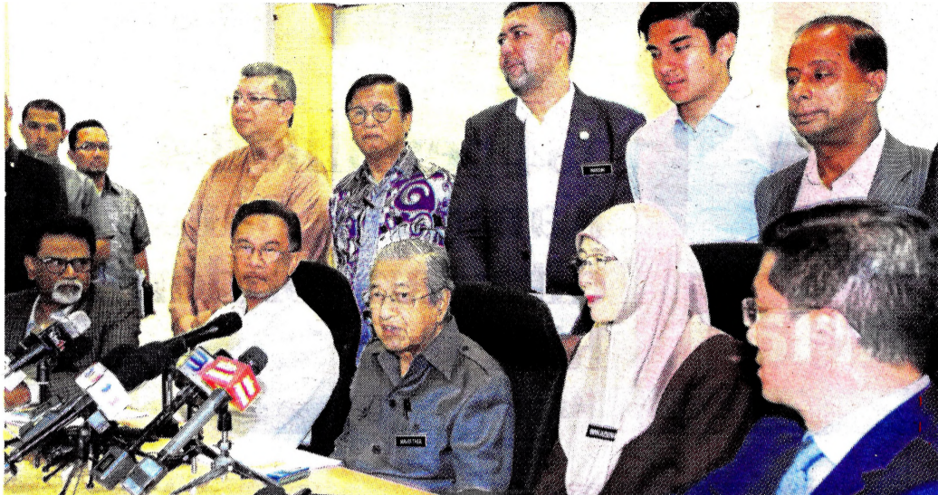
Dr Mahathir pada sidang media selepas mempengerusikan mesyuarat Majlis Presiden Pakatan Harapan (PH) di Yayasan Al-Bukhary, di Kuala Lumpur, semalam.

Jika tanah berkenaan telah dibeli oleh mana-mana pihak, kerajaan perlu membelinya semula"