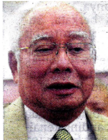
NAJIB TUN RAZAK