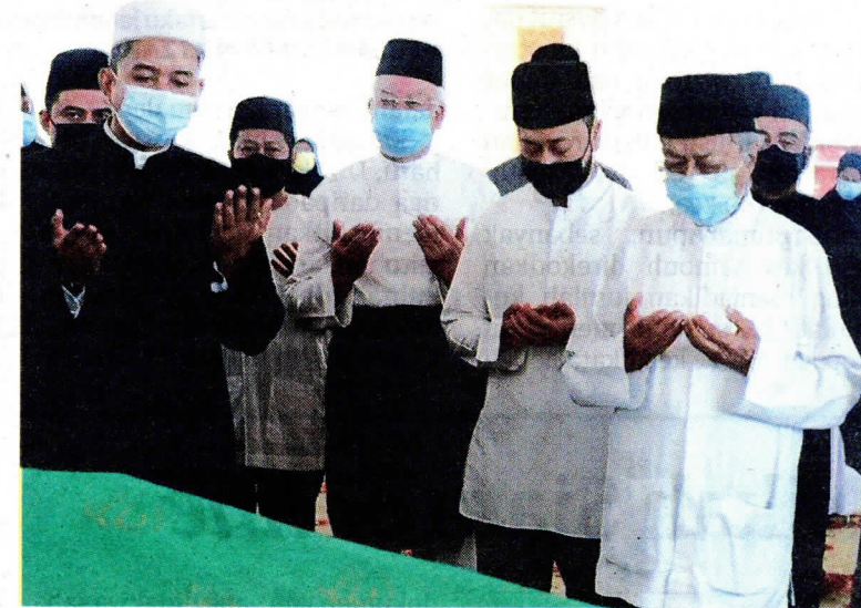
TUN Dr. Mahathir Mohamad dan Tun Dr. Siti Hasmah Mohamad Ali ketika memberi penghormatan terakhir kepada Allahyarhamah Tun Rahah.

Pemimpin-pemimpin UMNO seperti Datuk Seri Ahmad Zahid Hamidi dan Ahmad Maslan, ahli politik pembangkang iaitu Datuk Seri Dr. Wan Azizah Wan Ismail,