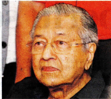
Dr Mahathir Mohamad

Langkah bagi ketahu mengapa rakyat Sabah kecewa dengan pemerintahan ketika ini