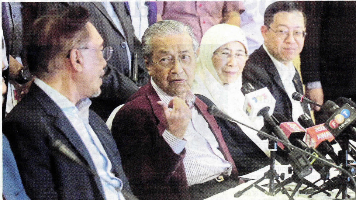
Dr Mahathir bersama Presiden PKR, Datuk Seri Anwar Ibrahim, Presiden PH, Datuk Seri Dr Wan Azizah Wan Ismail dan Setiausaha Agung DAP, Lim Guan Eng pada sidang media selepas mempengerusikan Mesyuarat Majlis Presiden PH di Putrajaya, malam tadi.

janji boleh ditunaikan kerana kami jadi kerajaan di Johor dan Pusat, tetapi kemenangan calon Barisan Nasional (BN) melalui MCA kalau menang tak boleh buat apa-apa.