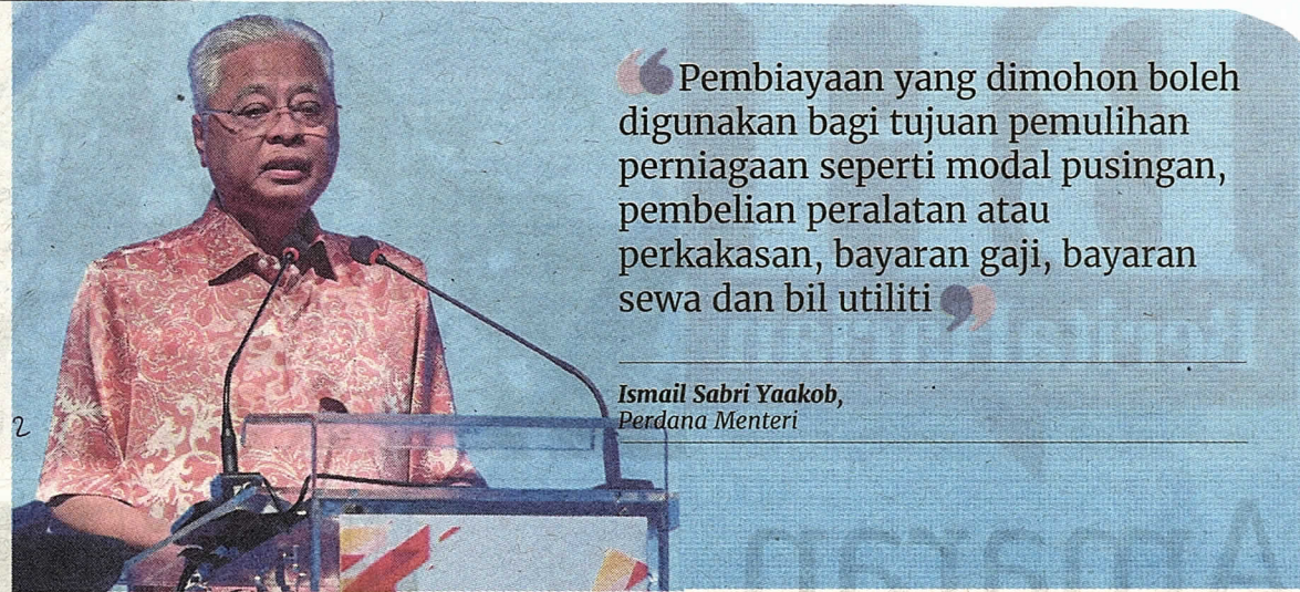
Ismail Sabri Yaakob, Perdana Menteri

Ismail Sabri menyampaikan ucapan pada perasmian Sambutan Hari Penjaja dan Peniaga Kecil Keluarga Malaysia Peringkat Kebangsaan 2021 di Putrajaya, semalam.