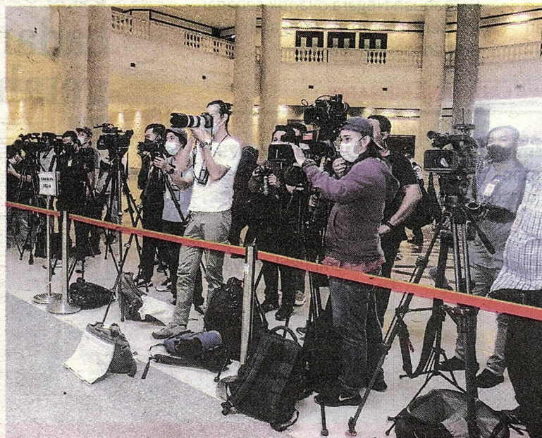
SEBAHAGIAN petugas media yang membuat liputan di Mahkamah Rayuan di Putrajaya, semalam.

"Bukti menunjukkan di antara tahun 2014 hingga 2015, sebanyak RM136 juta telah digunakan oleh perayu walaupun beliau mempercayai RM49 juta