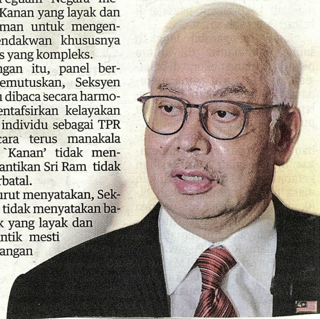
NAJIB TUN RAZAK