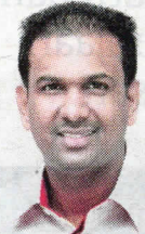
Timbalan Pengarah Pusat Kokurikulum dan Pembangunan Pelajar, Universiti Putra Malaysia (UPM)

Itulah maksud sebenar semangat kebersamaan dititahkan Raja Melayu. Ia perlu disuburkan demi membina semula bangsa dan negara terutama pada waktu pasca pandemik.