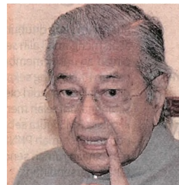
DR. MAHATHIR MOHAMAD

Najib kemudian memetik kenyataan Datuk Seri Mukhriz Mahathir pada 13 Julai 2017 yang mengakui bapanya dan Muhyiddin merancang untuk menjatuhkannya.