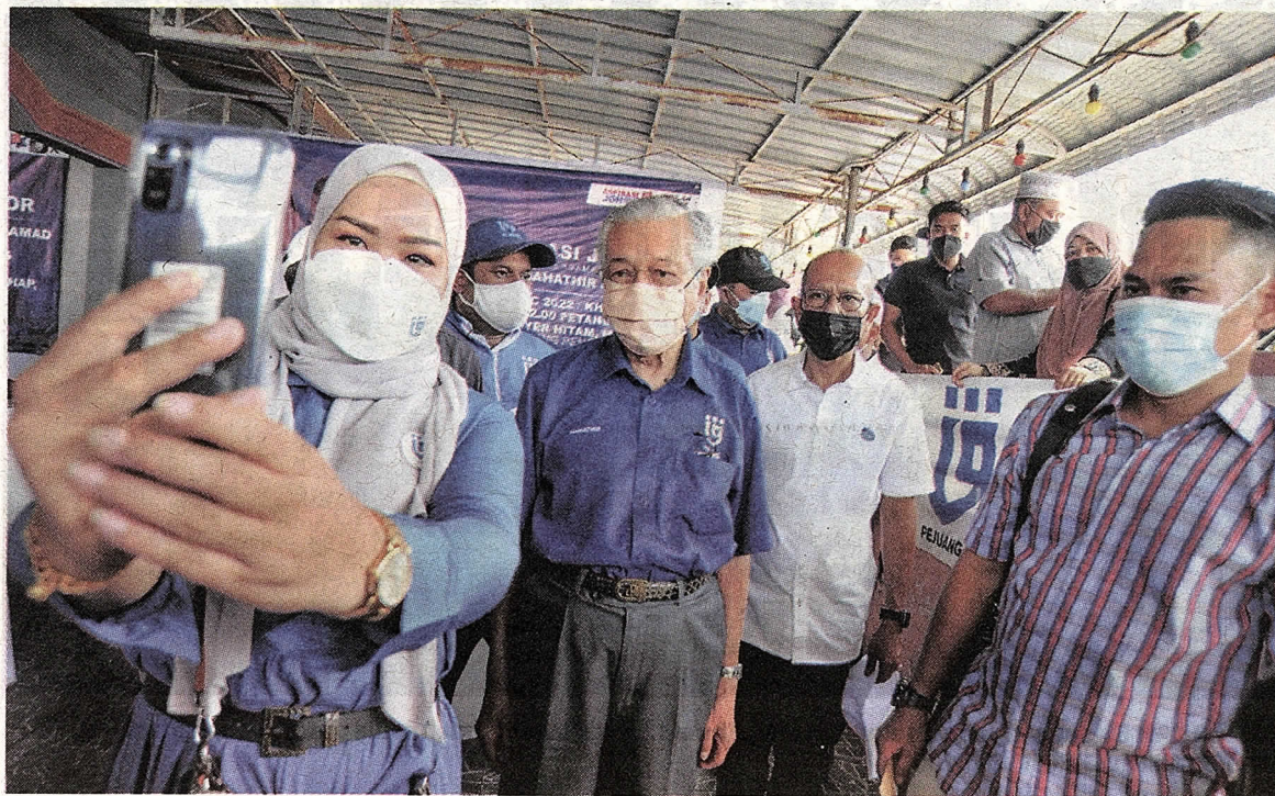
DR. Mahathir Mohamad (tengah) tidak menolak kemungkinan Pejuang akan mengadakan kerjasama dengan parti-parti lain pada PRU15 nanti.

Tindakan Datuk Zuraida Kamaruddin keluar Bersatu baru-baru ini. Sekiranya Tun berada di tempat Datuk Seri Ismail Sabri Yaakob, adakah kedudukan Zuraida dikekalkan?