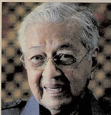
DR. MAHATHIR MOHAMAD

"BN menang pilihan raya kecil (PRK) dan pilihan raya negeri (PRN) sebelum ini bukan kerana pertambahan undi yang men-