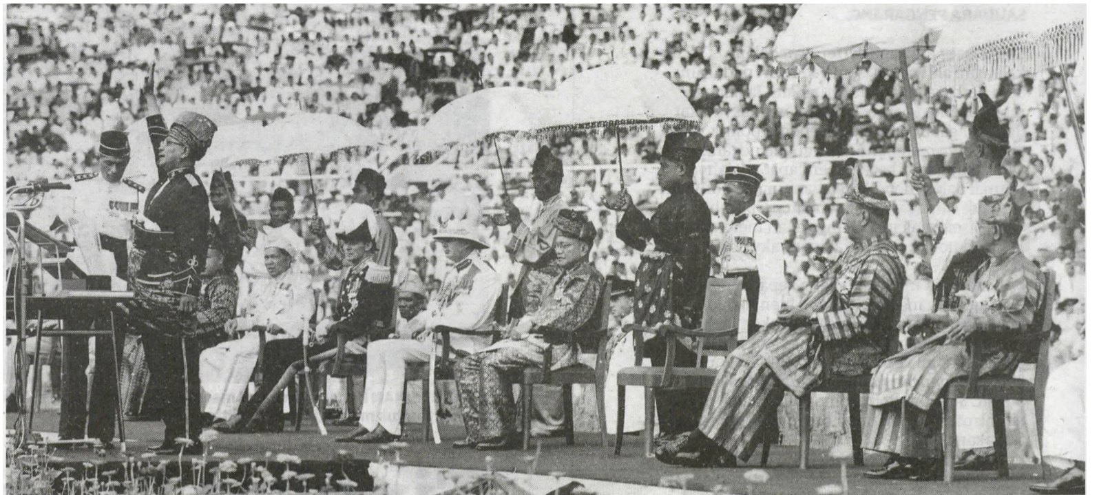
MAJLIS pengisytiharan kemerdekaan negara oleh Tunku Abdul Rahman Putra Al-Haj pada 31 Ogos 1957 di Stadium Merdeka yang penulis hadiri masih segar dalam ingatannya.

Usaha murni mereka yang tidak mementingkan diri dilakukan melalui kepercayaan rohani yang