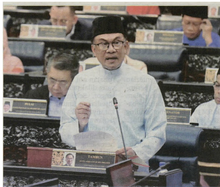
ANWAR Ibrahim ketika membentangkan Belanjawan 2023 di Parlimen, semalam.

Katanya, kerajaan pimpinannya bertekad membaiki sistem pentadbiran dan memastikan