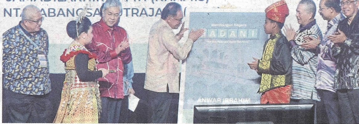
Anwar diiringi Ahmad Zahid dan Fadillah (tiga dari kanan) menyempurnakan gimik perasmian amanat Membangun Malaysia MADANI di Pusat Konvensyen Antarabangsa Putrajaya, semalam.

JAMADILAKHIR 1444H (KHAMIS) NT, ABANGSA PUTRAJAYA