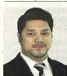
Pensyarah Kanan Politik Ekonomi Antarabangsa, Pusat Pengajian Antarabangsa (SOIS), Universiti Utara Malaysia (UUM)