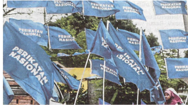
DAP salahkan gabungan PN yang didakwa menjadi punca kerajaan dikatakan tak stabil.