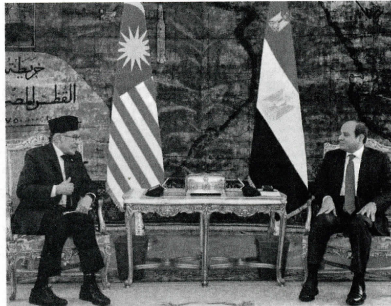
HUBUNGAN erat Perdana Menteri, Datuk Seri Anwar Ibrahim dengan Presiden Mesir, Abdel Fattah Al-Sisi berjaya melaksanakan misi tanpa pengetahuan Israel.