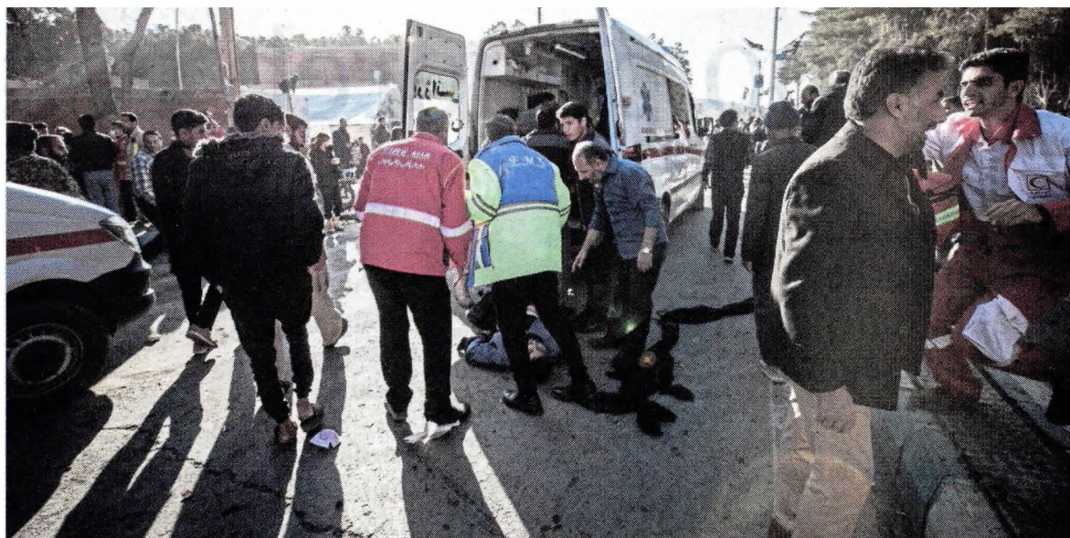
Anggota penyelamat membantu mangsa yang cedera dalam insiden pengeboman di Kerman, Iran, semalam.

Malaysia juga menggesa dalang aksi ganas ini diheret ke muka pengadilan.