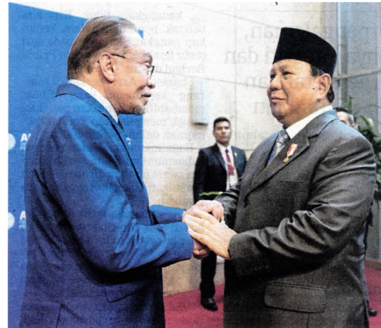
Anwar bersalaman dengan Prabowo ketika menghadiri Dialog Pemimpin Ekonomi APEC bersama Majlis Penasihat Perniagaan APEC.

Dalam kesempatan itu, kedua-dua pemimpin berkenaan