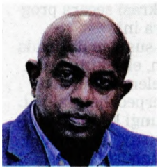
Pensyarah Pusat Pengajian Sains Kemasyarakatan, Universiti Sains Malaysia