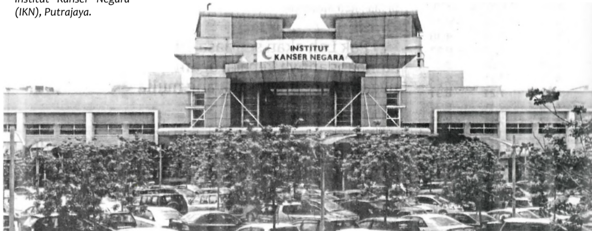
Institut Kanser Negara (IKN), Putrajaya.

“Cetusan idea menjadikan anak-anak Islam sejak 2004 celik al-Quran, memahami asas farduan, mempelajari bahasa Arab dan menghidupkan kembali tulisan Jawi,” katanya.