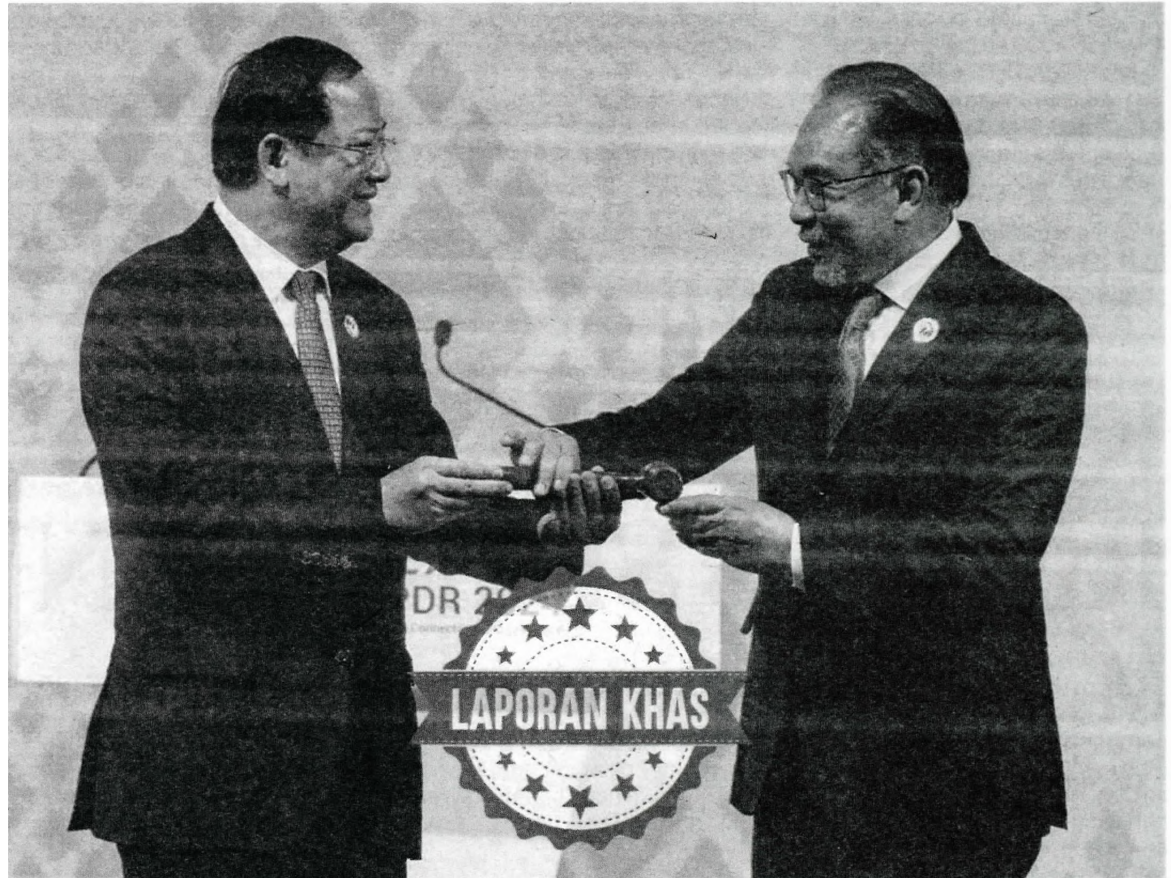
ANWAR menerima tukul kayu Pengerusi ASEAN daripada rakan sejawatnya dari Laos, Sonexay Siphandone semasa Majlis Penutup Sidang Kemuncak ASEAN ke-44 dan ke-45 Oktober tahun lalu.

lestari oleh Kementerian Sumber Asli dan Alam Sekitar (NRES) serta komitmen Kementerian Luar Negara untuk menjadikan media sebagai platform berkesan untuk pelbagai inisiatif ASEAN.