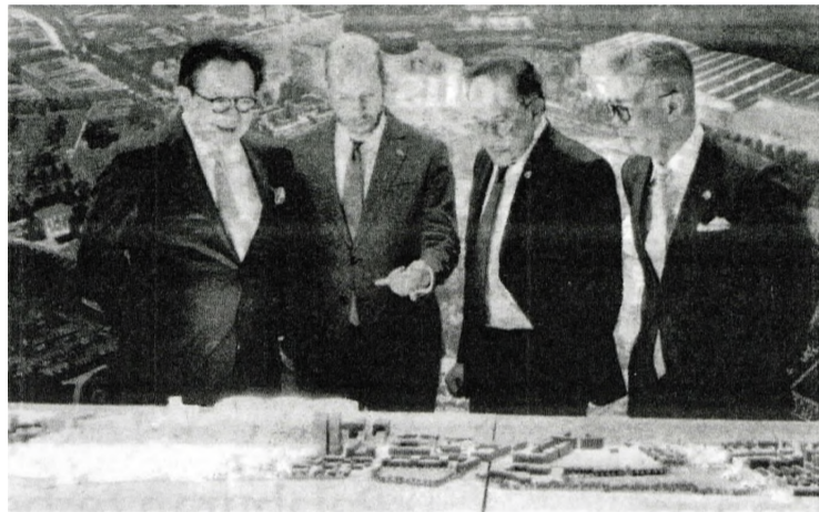
ANWAR Ibrahim melihat model bandar baharu Brabazon selepas majlis pelancaran di London semalam.

"Kami senada dan sepakat untuk meningkatkan kerjasama strategik yang lebih erat dalam bidang pendidikan, ekonomi, pertahanan, tenaga serta kecerdasan buatan (AI). Kami turut membincangkan usaha penyelesaian terhadap isu Gaza," katanya menerusi