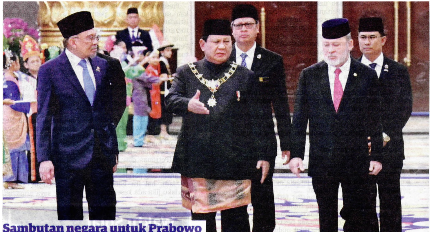
Sambutan negara untuk Prabowo

“Oleh itu, kita harus tingkatkan hubungan baik ini ke bidang lain seperti ekonomi, perdagangan, pelaburan. Tidak juga dilupakan dalam bidang pendidikan, kajian, teknologi makanan, industri hiliran dan tenaga.