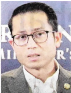
Tunku Nashrul Abaidah

Tunku Nashrul berkata demikian pada Taklimat Harian Pejabat Perdana Menteri yang di-