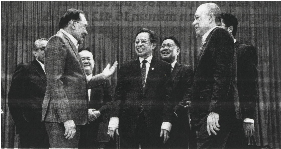
ANWAR Ibrahim menyatakan sesuatu kepada Abang Johari Tun Openg sambil diperhatikan Fadillah Yusof pada Majlis Pertukaran Memorandum Persefahaman antara Kerajaan Persekutuan dan Kerajaan Sarawak di Bangunan Perdana Putra, Putrajaya, semalam.