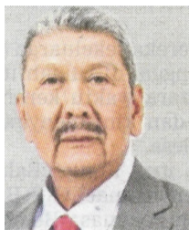
Ketua Pengarah Perkhidmatan Awam

• Kita mesti menjadi peneraju reformasi, mempercepat penyampaian perkhidmatan, memodenkan sistem dan menghidupkan semangat akauntabiliti baharu