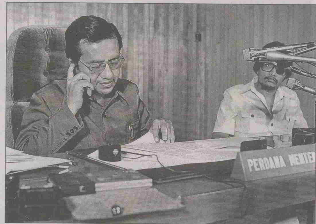
DR MAHATHIR mengumumkan barisan Kabinet pada Julai 1981 dan kiri membuang undi di Sekolah Kebangsaan Titi Gajah, Alor Star pada Pilihan Raya Umum 1982.