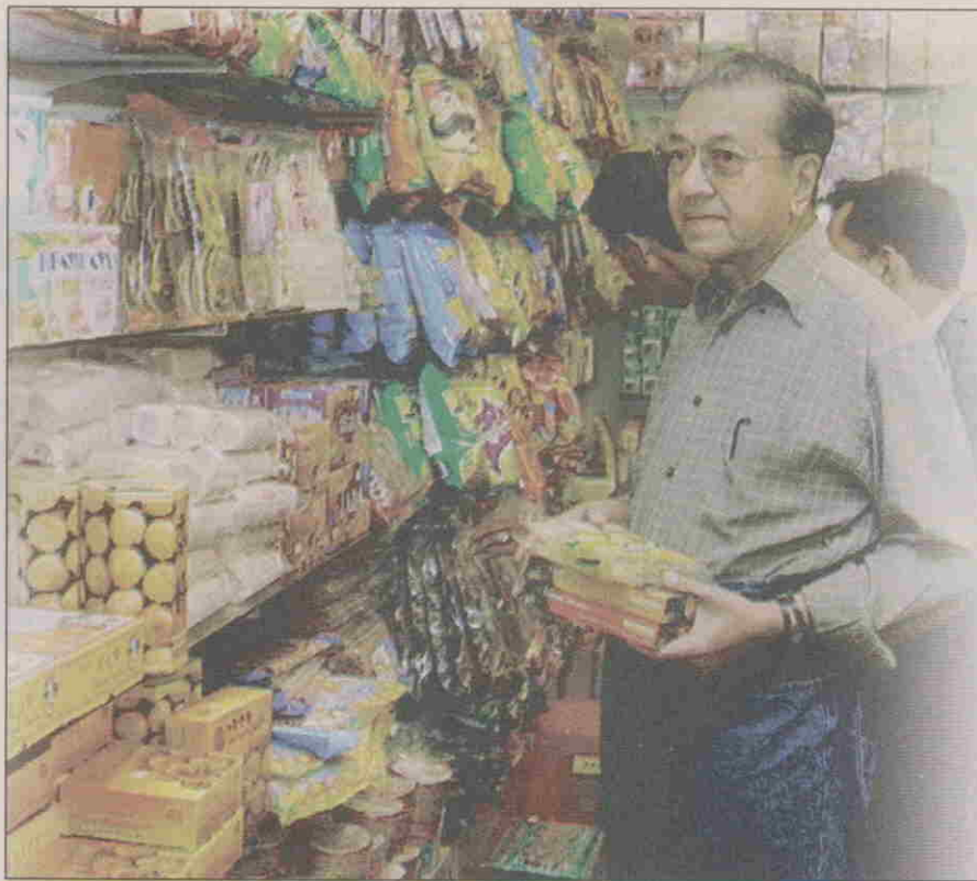
DR MAHATHIR sempat membeli-belah di Sky Mall di Lapangan Terbang Antarabangsa Langkawi sebelum berlepas pulang ke ibu negara.

Kini, menerusi Lembaga Pembangunan Langkawi (Lada) sebagai badan pelak-