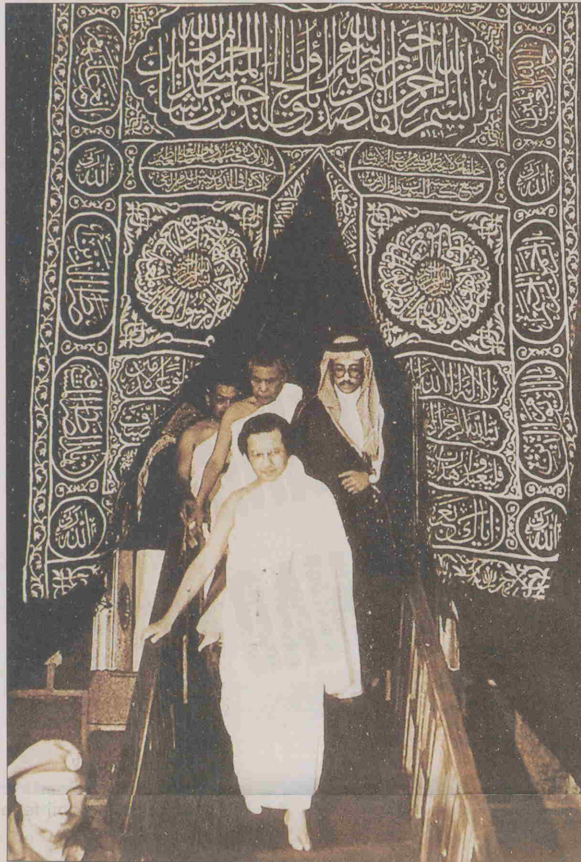
DR MAHATHIR keluar dari Kaabah selepas solat di dalamnya ketika mengerjakan ibadat haji pada 1997.

Beliau berkata, tugasnya cukup mudah sepanjang me-