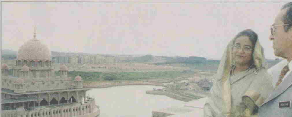
PERDANA Menteri Bangladesh, Sheikh Hasina mendengar penjelasan Dr Mahathir mengenai Masjid Putra dari pejabat Perdana Menteri.