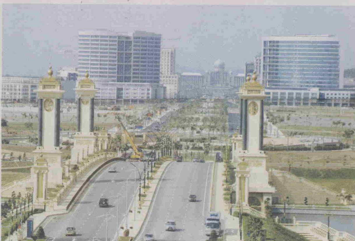
PEMANDANGAN pusat pentadbiran Putrajaya ketika persiapan persidangan OIC.