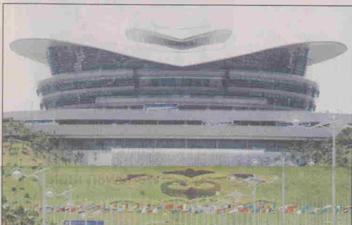
PUSAT Konvensyen Putrajaya.

Putrajaya Lambang negara bangsa merdeka Putrajaya Lambang negara bangsa merdeka Putrajaya Lambang negara bangsa merdeka.