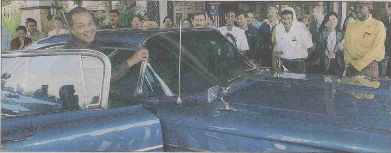
DR MAHATHIR memandu sendiri kereta peribadinya, Pontiac Star Chief Model 1959, model kereta yang pernah dimilikinya ketika bertugas sebagai seorang doktor.