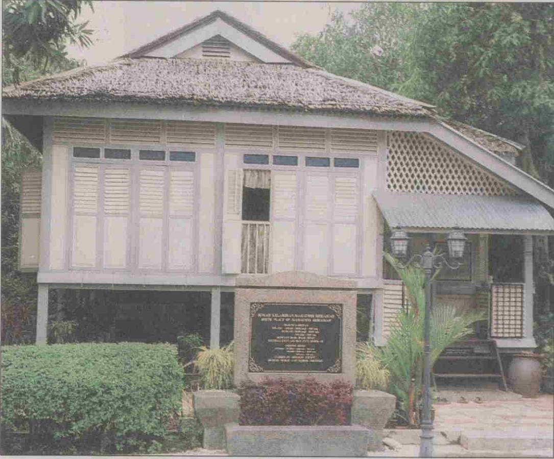
PANDANGAN bahagian depan rumah kelahiran Mahathir di Lorong Kilang Ais Seberang Perak, Alor Star.

Mahathir Mohamad, kita akan dipamerkan peralatan asal atau yang sejenis dengan bahan kepunyaan keluarga Dr Mahathir.