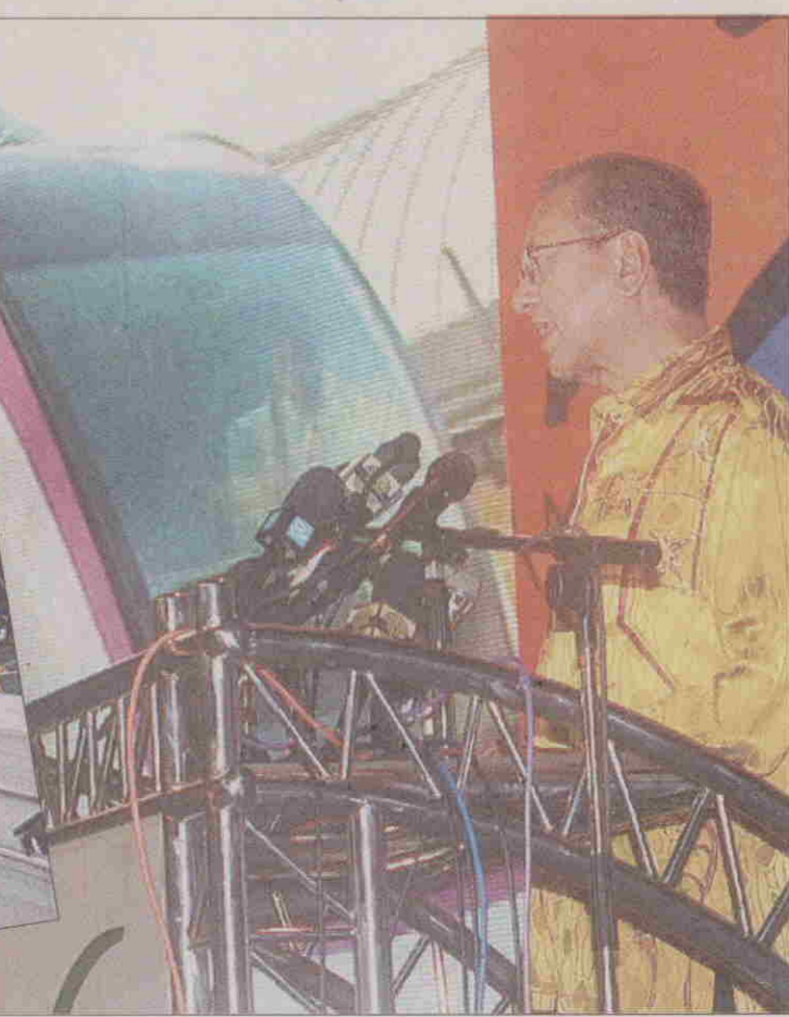
DI BAWAH pemerintahan Dr Mahathir, Komuter, LRT, ERL dan monorail dimajukan di Kuala Lumpur.