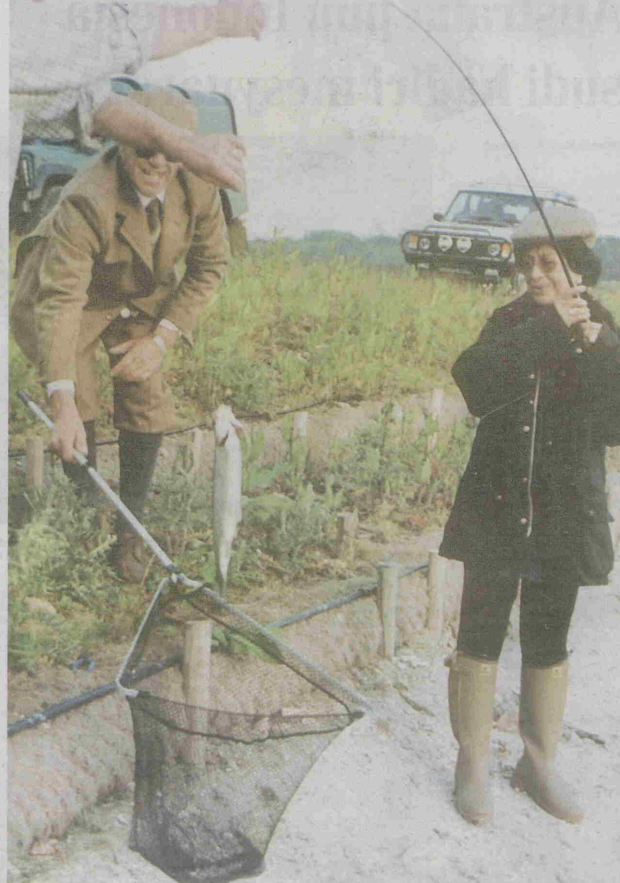
DR Siti Hasmah memancing ikan trout ketika bercuti di England, beberapa tahun lalu.

Kepada Dr Mahathir, Unit Joran dan Team Joran merakamkan ucapan terima kasih di atas segala usaha, jasa dan kebijaksanaan beliau untuk membawa rakyat mahupun negara ini ke persada gemilang.