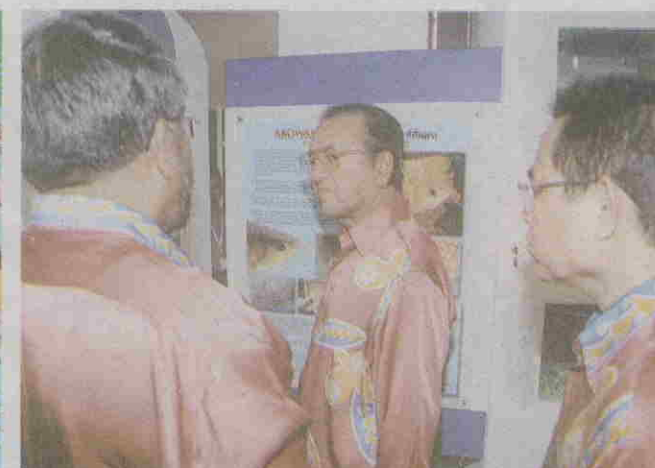
DR Mahathir meninjau satu pameran industri perikanan dan akuakultur.