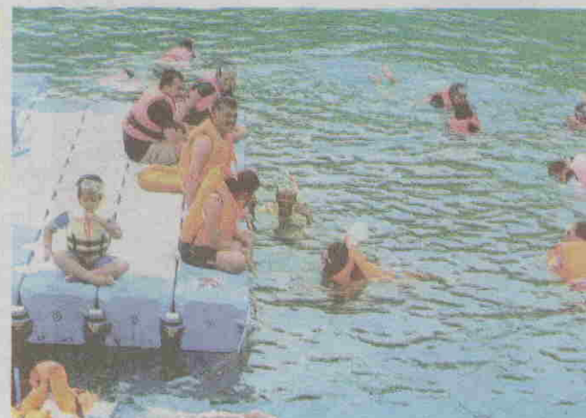
KEGIATAN ekotourisme dipopularkan sejak beberapa tahun lalu.