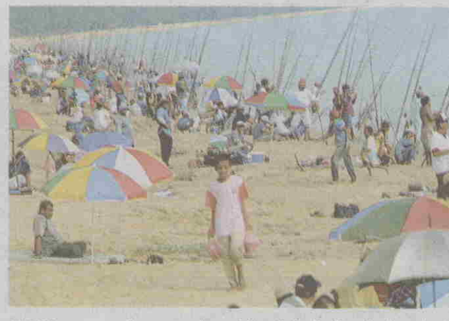
HOBII memancing mendapat faedah daripada langkah menurunkan cukai import peralatan itu ketika kerajaan di bawah pentadbiran Dr Mahathir.