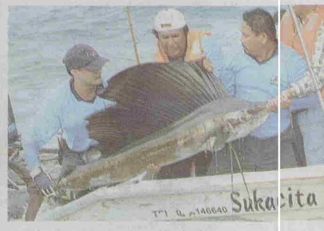
DATUK Paduka Abdul Kadir Sheikh Fadzir memancing layaran di Rompin - satu produk yang disasarkan oleh Dr Mahathir untuk menarik pelancong asing.