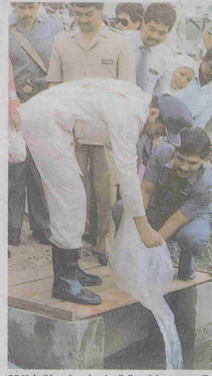
DR Mahathir melepaskan benih ikan dalam satu majlis di Johor pada 1987.