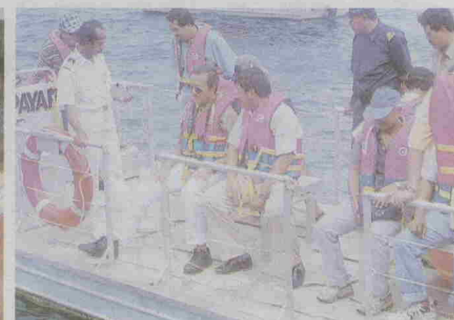
KESIBUKAN tugas tidak menghalang Dr Mahathir daripada meninjau pembangunan Pulau Payar.