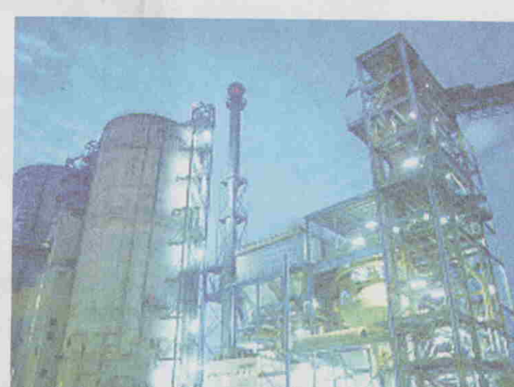
YTL Cement yang tersenarai di papan kedua Bursa Saham Kuala Lumpur pada tahun 1993 dengan nama Buildcon Berhad.