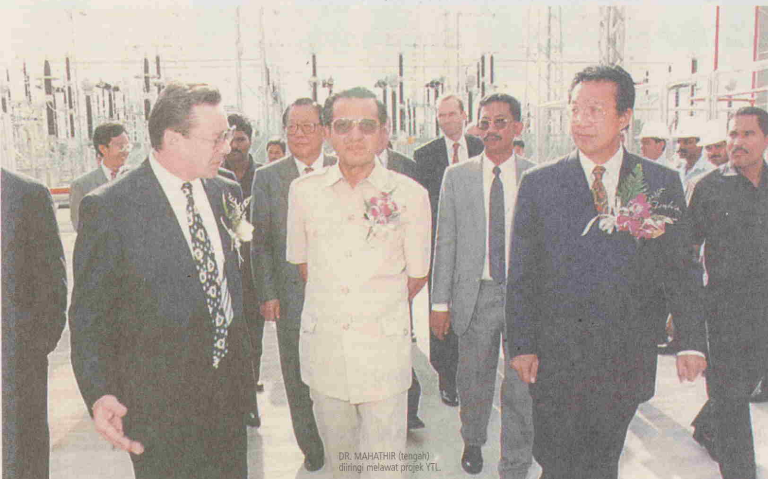
DR. MAHATHIR (tengah) diiringi melawat projek YTL.

Wessex Water merupakan syarikat yang beroperasi melibatkan 1.2 juta pelanggan di England termasuk Bristol, Dorset, Somerset dan beberapa bahagian di Wiltshire dan Gloucestershire, Hampshire dan Devon.