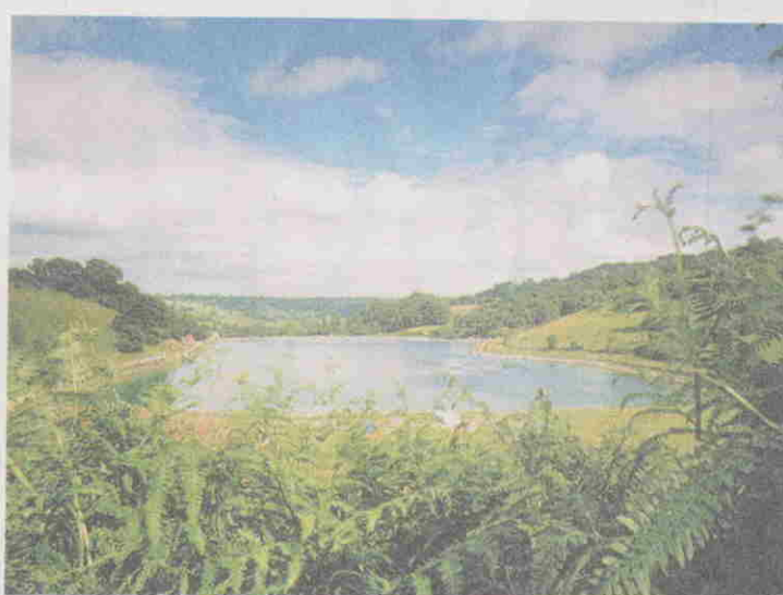
WESSEX Water Ltd, merupakan pelaburan terbesar YTL untuk memiliki syarikat air dan kumbahan di England.