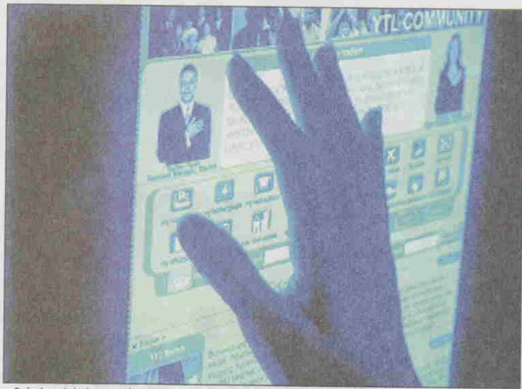
e-Solution, inkubator teknologi Kumpulan YTL antara lain menyediakan teknologi paparan digital dari portal pembangunan.