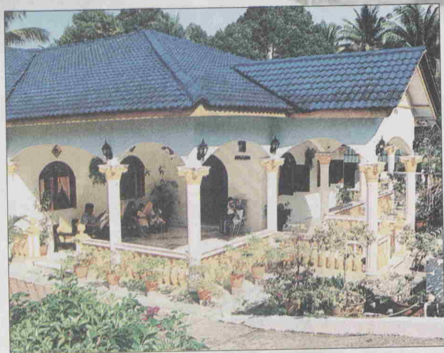
KEMASUKAN peneroka ke tanah rancangan.

Selain itu, katanya, golongan peneroka juga diminta agar meningkatkan taraf hidup mereka dengan berkecimpung dalam pelbagai aktiviti sampingan seperti keusahawanan dan sebagainya untuk memastikan hasrat Dr. Mahathir terlaksana.