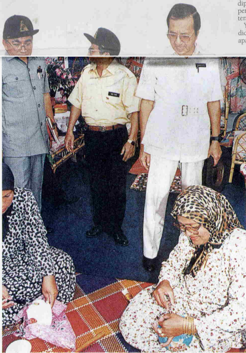
DR. MAHATHIR memerhati demonstrasi kraf tangan oleh penerokawati Felda.