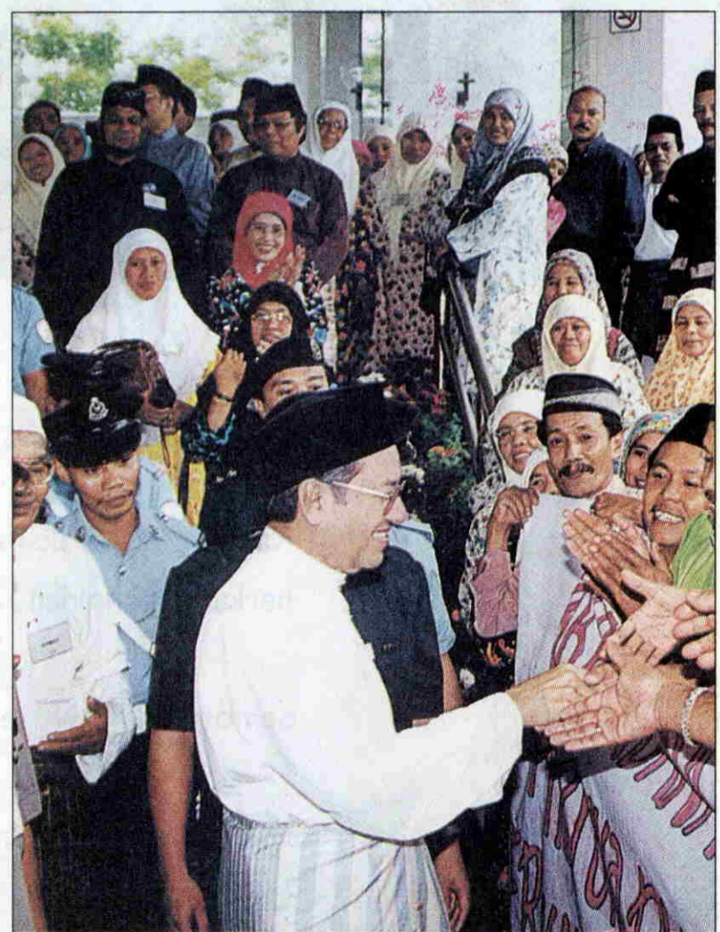
PERDANA Menteri bermesra dengan warga peneroka.