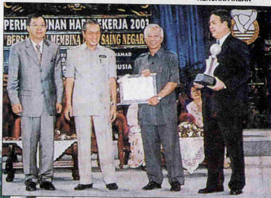
DR. MAHATHIR di majlis Anugerah Ladang Bahagia Negara sempena Hari Pekerja 2003.

“Walaupun minyak sawit dijadikan mangsa serangan pengeluar minyak soya dari Amerika dan Eropah, tetapi Dr. Mahathir tetap bertegas mempromosikan minyak sawit tempatan”