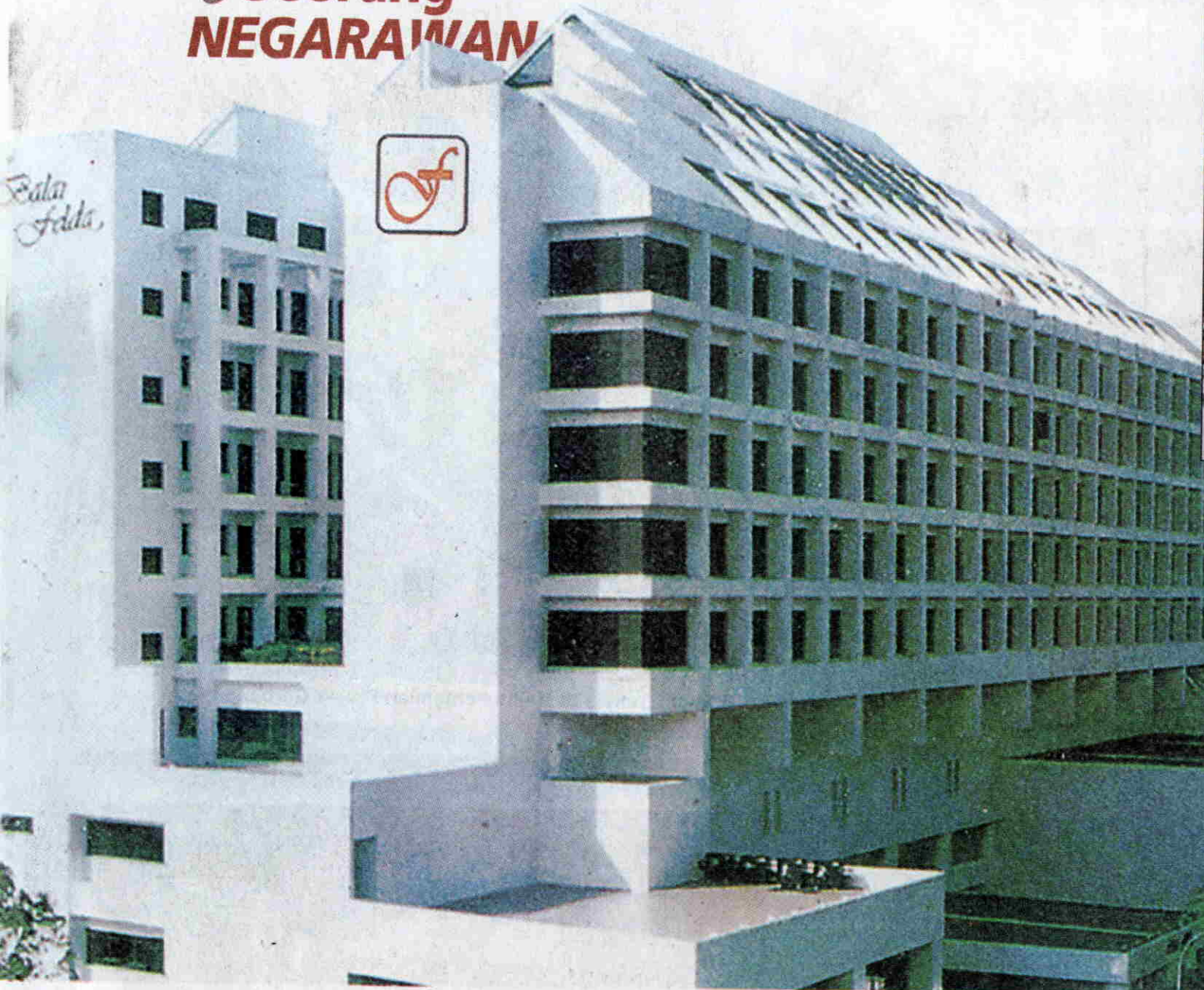
IBU Pejabat Felda Holding.