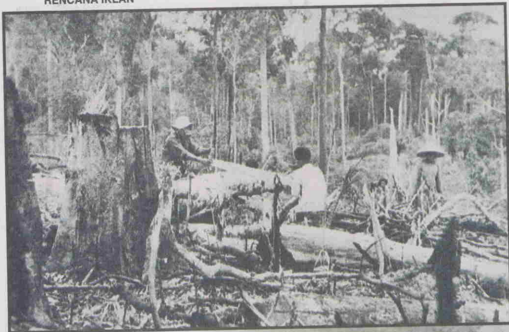
PEMBUKAAN awal tanah rancangan.