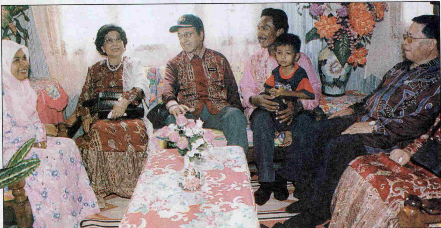
DR. MAHATHIR bersama keluarga peneroka.