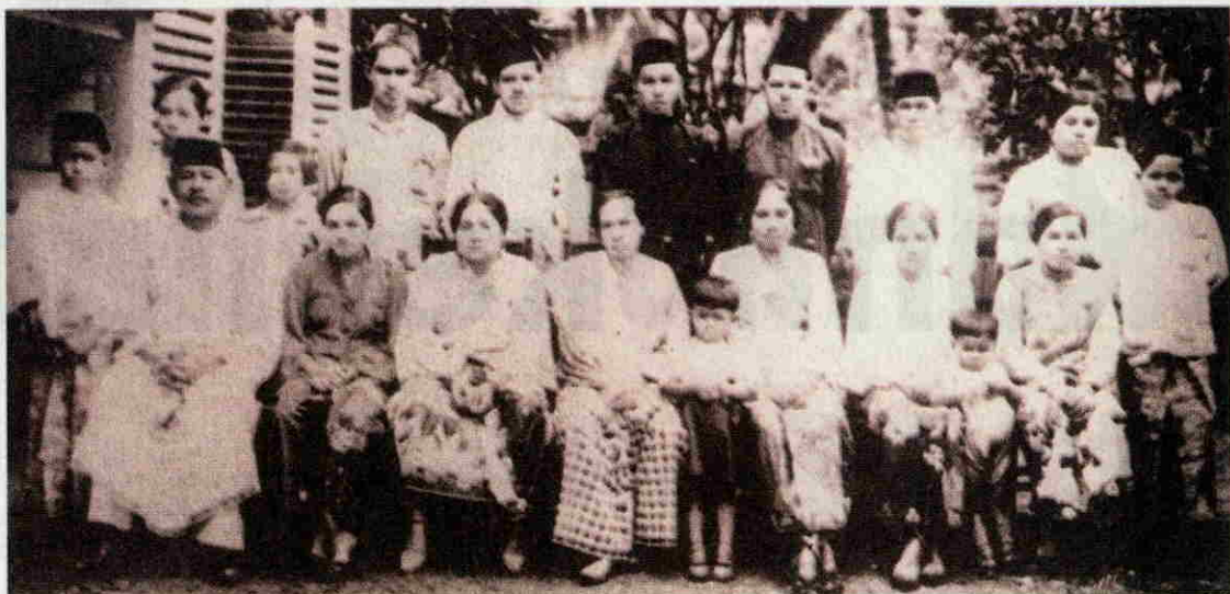
DR. MAHATHIR (berdiri di kiri sekali) bersama keluarganya di rumahnya di Jalan Kilang Ais, Alor Star, Kedah.