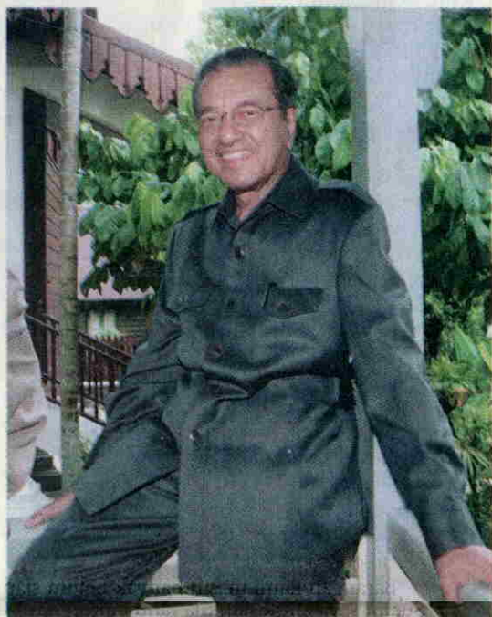
DR. MAHATHIR terkenang zaman kanak-kanaknya semasa bersandar di tiang beranda rumah kelahirannya di Jalan Pegawai, Alor Star.

Dr. Mahathir jelas apabila keputusan untuk mengundurkan diri daripada jawatan penting negara juga tidak dimaklumkan kepada kedua-dua kakaknya itu.