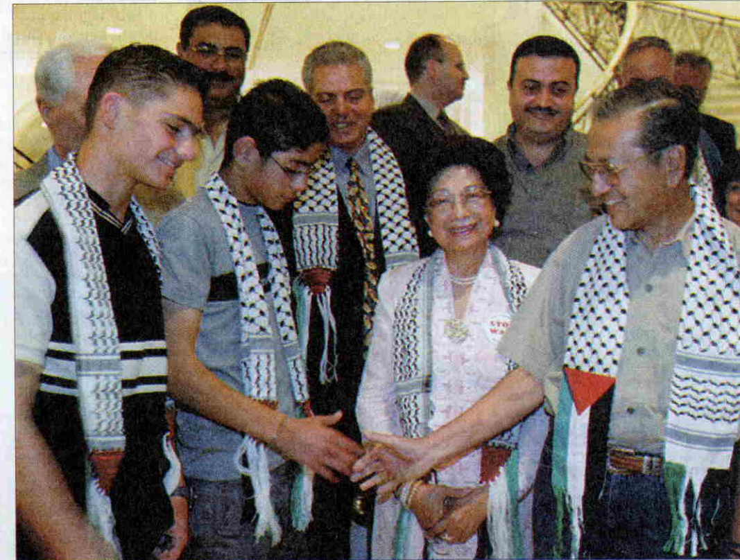
DR. MAHATHIR dan Dr. Siti Hasmah beramah mesra dengan beberapa rakyat Palestin di Seri Perdana.

"Namun Dr. Mahathir tidak terus ke saf depan walaupun beliau akan diberi penghormatan berbuat demikian tetapi sebaliknya Perdana Menteri bersembahyang