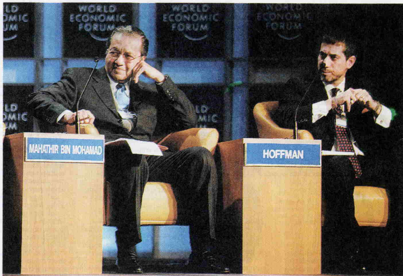
DR. MAHATHIR ketika menghadiri Forum Ekonomi Dunia di Davos, Switzerland.

Satu lagi kesan positif kepada Korea Selatan, Thailand dan