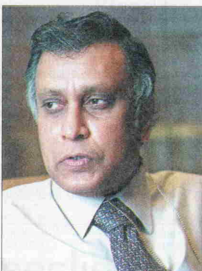
NOR MOHAMED YAKCOP

Indonesia berikutan langkah-langkah kawalan pertukaran asing yang dilaksanakan Malaysia ialah sikap Dana Kewangan Antarabangsa (IMF) dan negara-negara Barat.