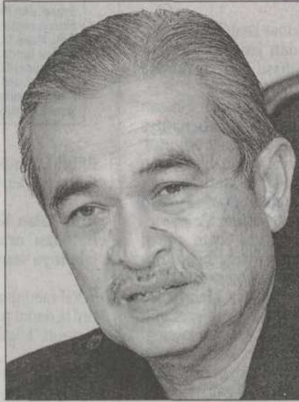
Abdullah Ahmad Badawi

Penjelajahannya berterusan pula ke Jepun dan China, dua daripada rakan dialog Asean yang masing-masing dianggap sebagai peluang dan cabaran. Lawatannya ke Korea Selatan yang dijangka bulan depan, bakal melengkapkan pusingan ke negara serantau.