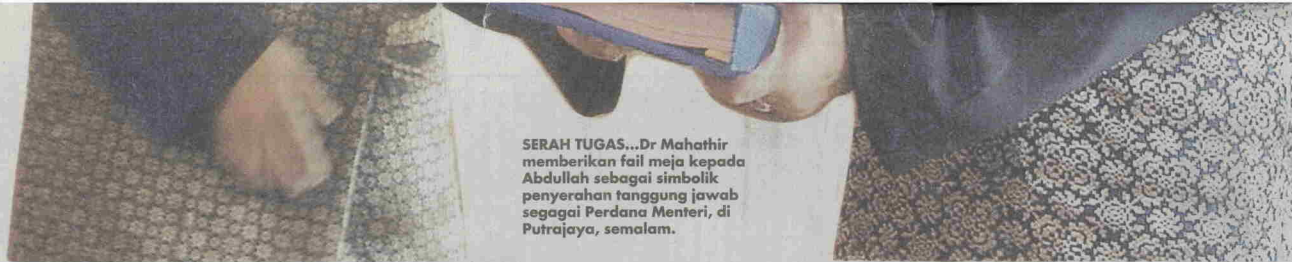
SERAH TUGAS... Dr Mahathir memberikan fail meja kepada Abdullah sebagai simbolik penyerahan tanggung jawab sebagai Perdana Menteri, di Putrajaya, semalam.