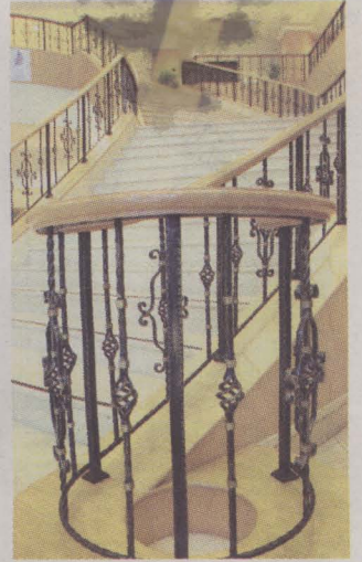
SENI...selurur tangga ukiran indah besi tempawan.