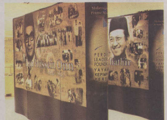
JADI KEBANGGAAN...pameran bergambar ini singkap sejarah bekas Perdana Menteri.