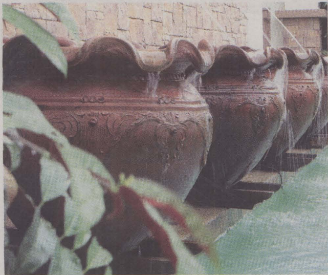
HALWA TELINGA...air pancuran di tempayan klasik.