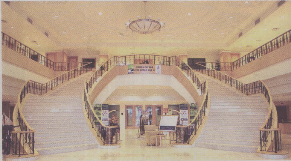
ILHAM KEJAYAAN...dekorasi tangga simbolik kegigihan usaha.