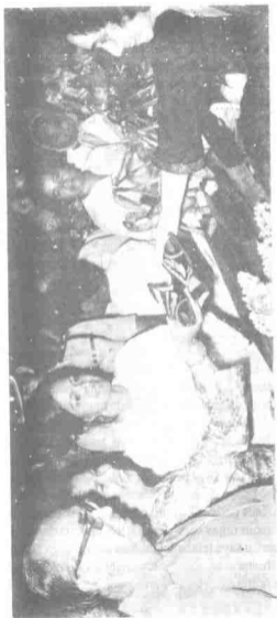
Bersama Perdana Menteri Tun Abdul Razak dan Toh Puan Rahah di Pesta Wanita di Kuala Lumpur pada 1973.