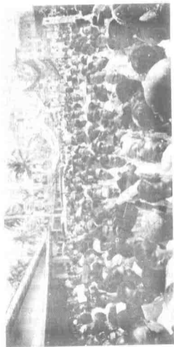
Satu perjumpaan Parti Semangat 46.