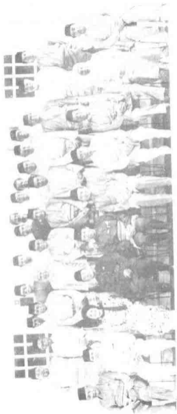
Ahli Majlis tertinggi Parti Semangat 46 yang pertama l 10 Mei 1990 l.