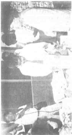
Di pejabat Pendaftaran Pertubuhan di Kuala Lumpur pada 8hb Februari 1988 untuk mendaftarkan UMNO Malaysia selepas UMNO diistiharkan tidak sah oleh Mahkamah Tinggi.