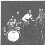
THE Muzik in action