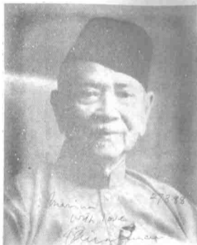
Yang Teramat Mulia Tunku Abdul Rahman Al-haj, Bapa Malaysia dan Perdana Menteri Malaysia pertama. Pemimpin yang di kasihi oleh semua rakyat Malaysia berbilang kaum dan dari segala lapisan masyarakat. Tunku juga kata ini mesej untuk perubahan di Malaysia.