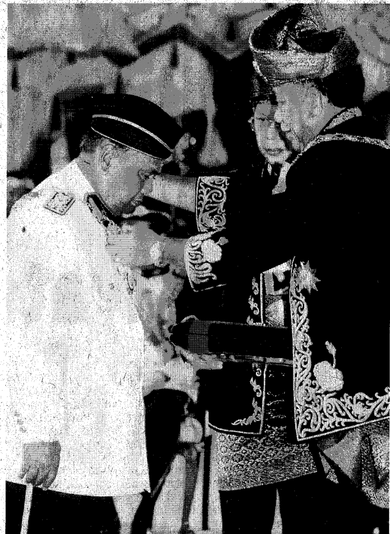
JASAMU DIKENANG: Tun Ghafar menerima anugerah Seri Setia Mahkota yang membawa gelaran Tun daripada Yang di-Pertuan Agong ke-10 pada 1995.