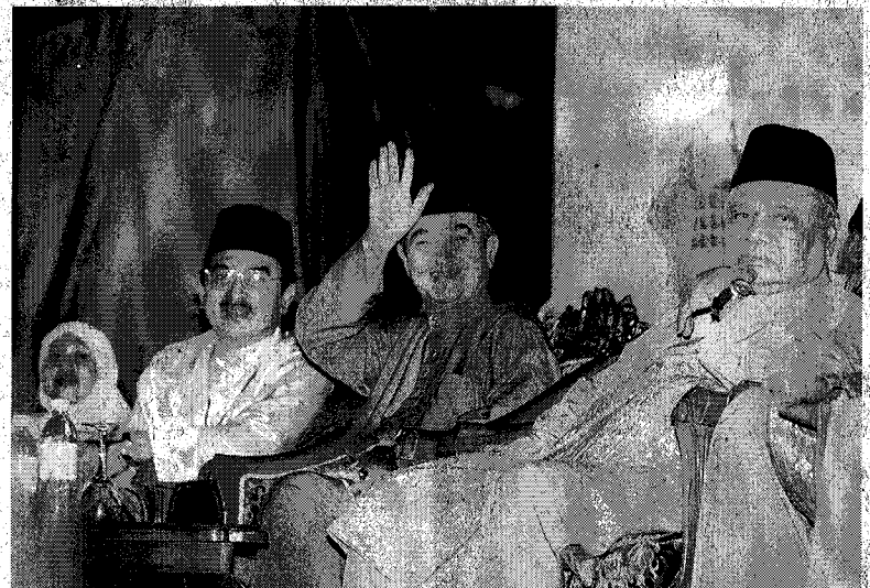
DALAM KENANGAN: Tun Ghafar bersama Perdana Menteri, Datuk Seri Abdullah Ahmad Badawi dan Ketua Menteri Melaka, Datuk Seri Mohd Ali Rustam.