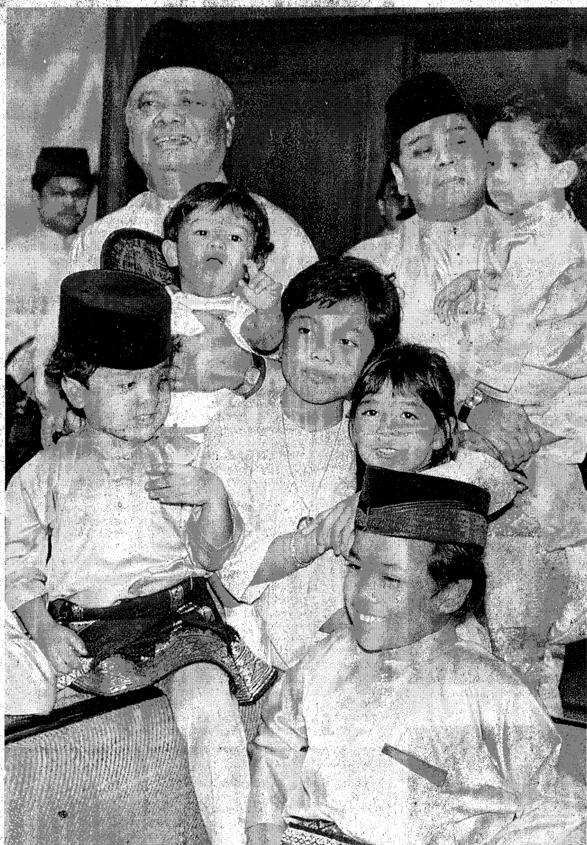
SENTIASA DI INGATAN: Tun Ghafar bergambar bersama cucunya ketika rumah terbuka Aidilfitri di Pusat Dagangan Dunia Putra (PWTC) pada 1987.

Pada 1969, beliau dilantik Menteri Pembangunan Luar Bandar sebelum bertukar ke Kementerian Pertanian dan Pembangunan Luar Ban-