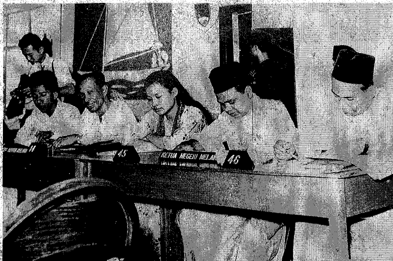
TINGGAL KENANGAN: Tun Ghafar ketika menghadiri Mesyuarat Agung Umno Malaya di rumah Umno Jalan Tunku Abdul Rahman, Kuala Lumpur pada 1958.